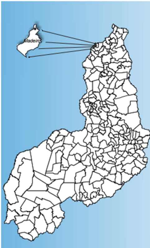
Figura 1: Localização do Município de Madeiro-PI.

A sede municipal tem as coordenadas geográficas de 03°28'58" de latitude sul e 42°30'16" de longitude oeste e dista cerca de 244 km de Teresina.